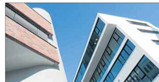
Spannende Perspektiven bei der Oberen Wässere.