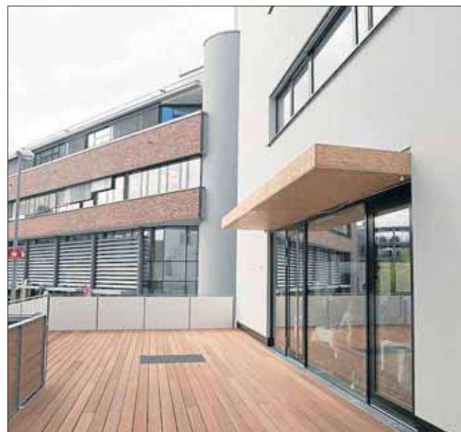
Im rückwärtigen Teil des Gebäudes befindet sich die Terrasse des italienischen Restaurants.

TEXT: CHRISTINE KNAUER