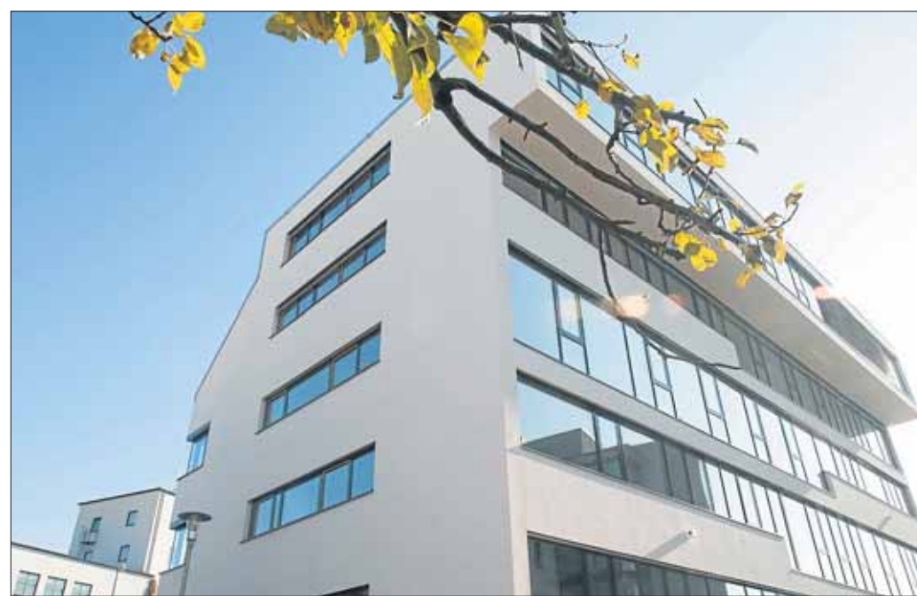
Die Albstraße 16-18 entstand unter der Federführung der Immobilienfirma Schöller & Partner.

Von dieser Infrastruktur profitieren nicht nur die Mieter im Haus, sondern auch deren Kunden, Klienten, Gäste und Patienten. Im Erdgeschoss befinden sich ein italienisches Restaurant sowie ein Küchenstudio. Das erste und zweite Obergeschoss dient einem Schuh-Vertrieb als